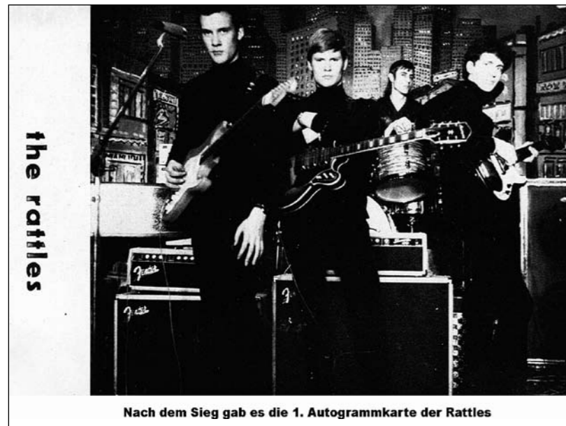
Nach dem Sieg gab es die 1. Autogrammkarte der Rattles